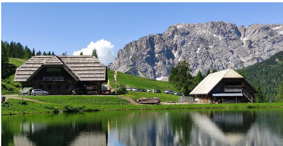
Watschiger Alm mit Roßkofel