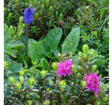
Wulfenia und Alpenrose Blütezeit im Juni